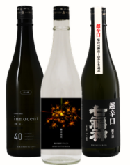
業1772年 岩手県最古の酒