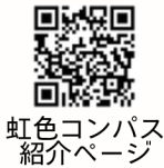
虹色コンパス 紹介ページ